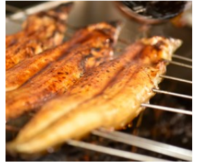
お昼ご飯にいかがですか?