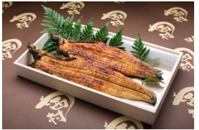
一人5,500円相当の高級鰻