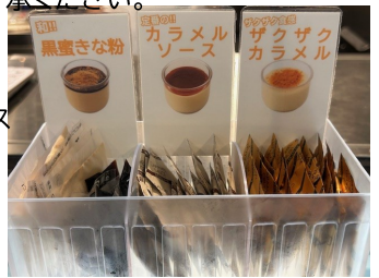
絶品豆乳チーズケーキと豆乳プリン