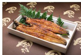
一人5,000円相当の高級鰻