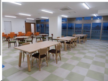
広々とした休憩所でおくつろぎいただけます。