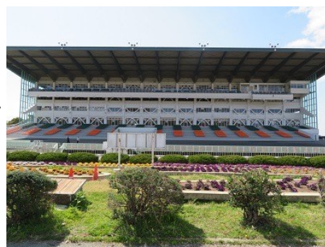
競馬場スタンドの4階に卓球場がございます。