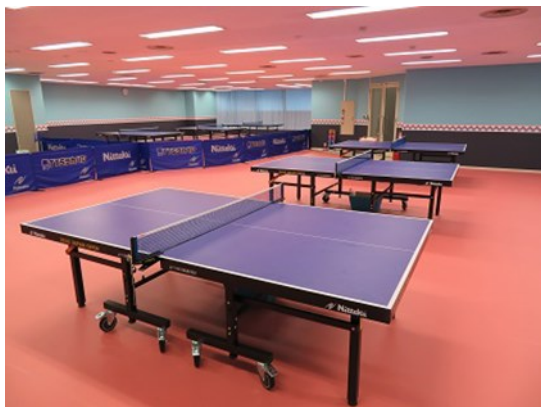
卓球台6台 冷暖房完備