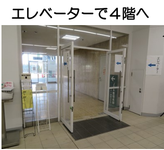
エレベーターで4階へ