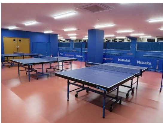
卓球台は合計16台。写真左奥に3台と直線で13台あります。