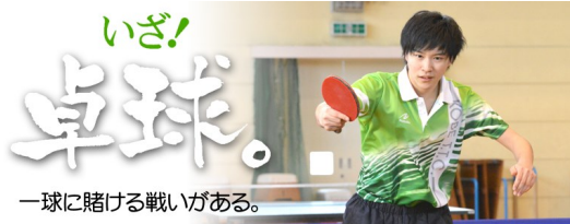
一球に賭ける戦いがある。